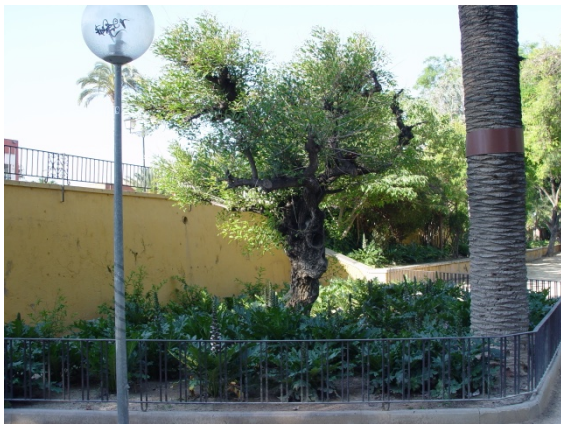
Foto 8. El árbol se va vistiendo de follaje y el parterre se planta con Acanthus mollis . Mayo de 2009

En el año 2006 se remodeló el jardín pensando en su aprovechamiento como recinto festero, cosa insólita según mi opinión, colocándole vallas metálicas perimetrales a los diversos parterres, lo que supuso por fin algo de protección a nuestro árbol, aunque seguían permitiendo la instalación de casetas en sus proximidades, como se aprecia en la foto de Marzo de 2006 con el árbol desprovisto de follaje, pues es caducifolio (foto 7).