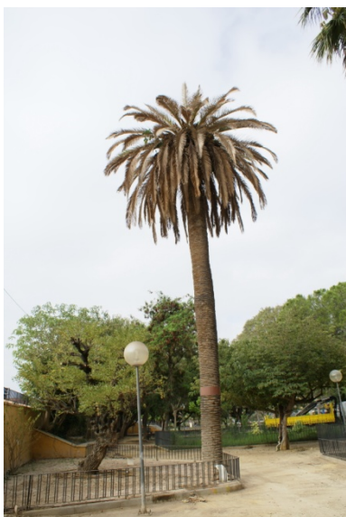
Foto 12. En el año 2013 se secó la Phoenix canariensis del parterre y fue talada

Todavía en el año 2010 se constata que las autoridades municipales (no olvidemos que la organización corría a cargo de la Concejalía de Cultura) continuaban permitiendo la colocación de casetas junto al árbol al llegar las fiestas, llegando a quitar una de las vallas metálicas para poder aprovechar mejor el espacio e incluso podar ligeramente al árbol, según parece apreciarse si comparamos su copa de la foto 9 del mes de Junio con la de las fotos 10 y 11 del mes de Septiembre.