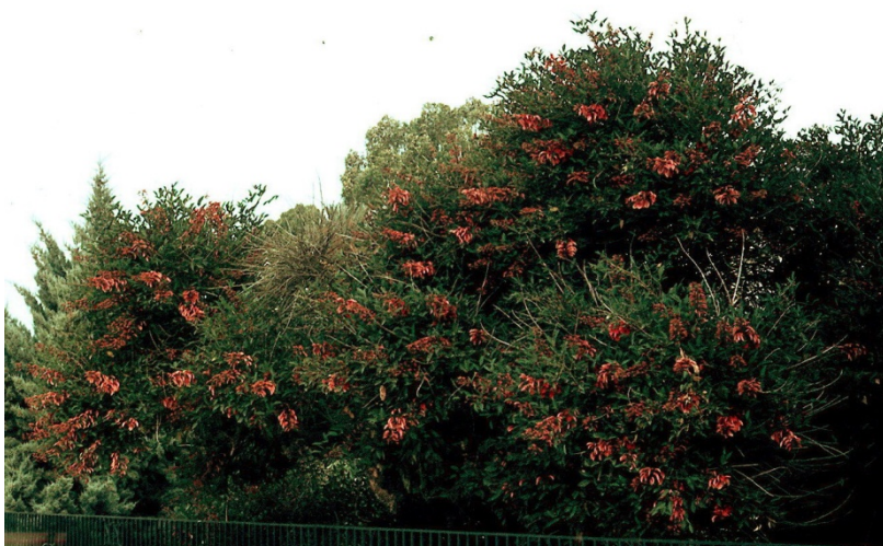
Foto 1. Erythrina crista-galli vista desde el Paseo del Malecón. Julio de 1981

Comencé a catalogar la flora ornamental del Municipio de Murcia a partir de fijar mi residencia en dicha ciudad en 1980, siendo entonces cuando supe de la existencia en el Jardín del Malecón de un viejo árbol de Erythrina crista-galli , una de las especies más conocidas y cultivadas dentro del género en España. Este ejemplar, que constituía entonces el único de su especie que había observado en Murcia (foto 1), a juzgar por su ubicación debió formar parte de las colecciones de plantas del antiguo Jardín Botánico, por lo que su edad aproximada podría estimarse actualmente entre los 80-90 años. Ya en los años 80 su tronco presentaba evidentes cicatrices de antiguas podas, algunas importantes, pues suprimieron varias de sus ramas principales.