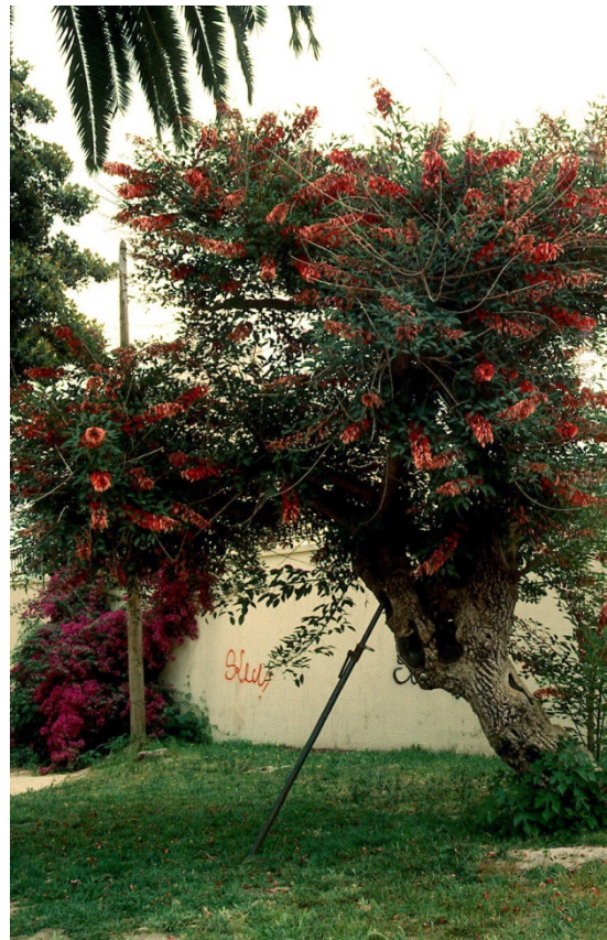
Foto 5. Árbol apuntalado. Mayo de 1994

Al parecer mi escrito tuvo cierto efecto, pues poco tiempo después estuvieron realizándole al árbol tareas de cirugía arbórea con muy buenas intenciones, como me consta, aunque a raíz de estas operaciones, en las que se eliminó cierta cantidad de madera supuestamente podrida en algunas antiguas heridas de podas, sin advertirlo se debilitó mecánicamente alguna zona del tronco, con tan mala