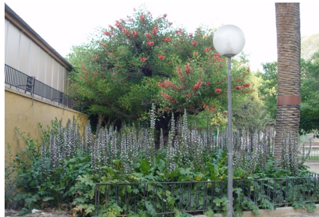
Foto 9. El árbol está pleno de follaje y se encuentra en plena floración, al igual que los acantos. Junio de 2010