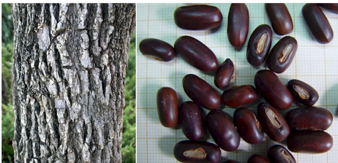
Detalle de la corteza del tronco y de las semillas

Localización: Especie muy poco representada en los jardines públicos de Murcia. El ejemplar más longevo e interesante se encuentra en el Jardín del Malecón, al que puede atribuírsele más de 70 años de edad; su porte se ha visto mermado en los últimos años debido a la podredumbre y posterior rotura de algunas de sus ramas principales. Un ejemplar de menor porte puede contemplarse en los jardines del Cuartel de Artillería.