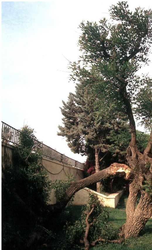
Foto 4. Caída de una rama principal en 1992