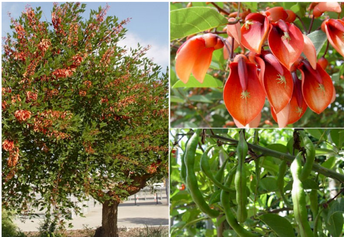
Aspecto general y detalle de las flores en Mayo y detalle de los frutos en Julio