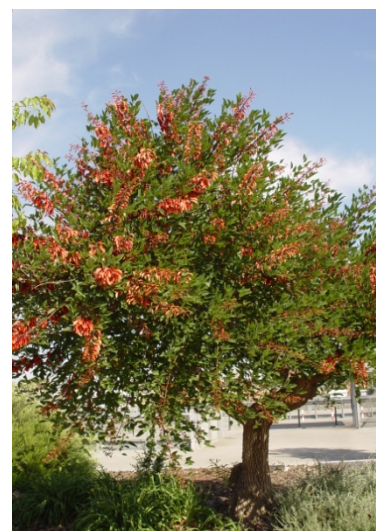
Foto 2. Erythrina crista-galli del Cuartel de Artillería. Mayo de 2010

Años después descubrí un segundo ejemplar más joven, situado en una zona de almacenes de la Avenida de Cervantes, desaparecido a causa de las obras de construcción de un supermercado de la cadena Lidl que actualmente ocupa esos terrenos, y un tercer ejemplar, más pequeño que los dos anteriores, se trasplantó desde unos jardines particulares en El Palmar hasta los jardines del Cuartel de Artillería cuando se realizaron éstos en 2006-2007, y puede ser contemplado en su ubicación actual. (foto 2).