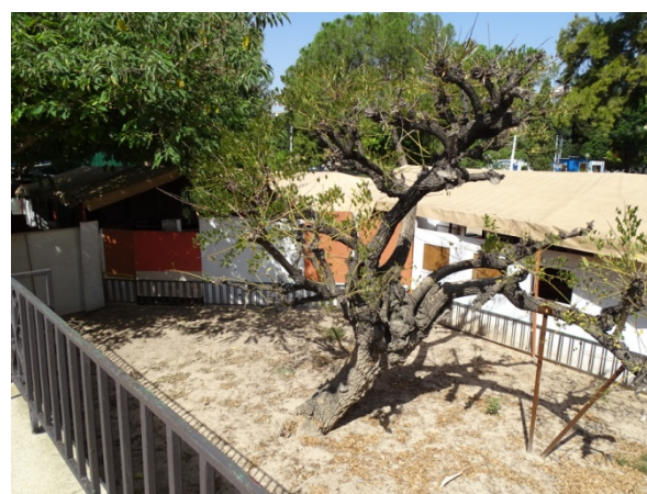
Foto 16. Casetas instaladas fuera del perímetro del parterre. Agosto de 2018, con el árbol casi sin follaje.

Y así se mantiene el árbol de momento, con un porte algo menor del que tenía originalmente y con ayuda de 2 muletas que sostienen una de sus ramas principales. Esperamos y deseamos que dure muchos años más para disfrute de todos. Se incluye a continuación la ficha completa de la especie.