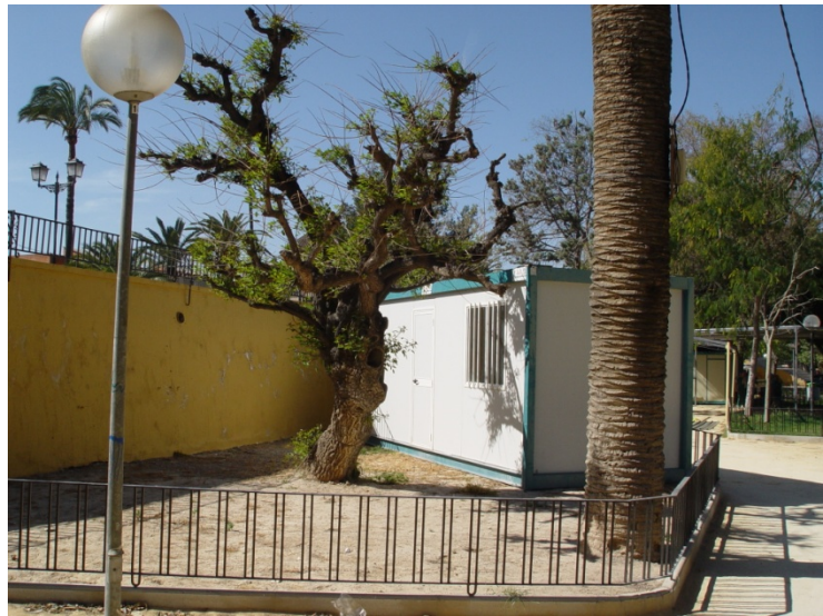
Foto 7. A pesar del vallado seguían instalando casetas. Marzo de 2006

En el año 2006 se remodeló el jardín pensando en su aprovechamiento como recinto festero, cosa insólita según mi opinión, colocándole vallas metálicas perimetrales a los diversos parterres, lo que supuso por fin algo de protección a nuestro árbol, aunque seguían permitiendo la instalación de casetas en sus proximidades, como se aprecia en la foto de Marzo de 2006 con el árbol desprovisto de follaje, pues es caducifolio (foto 7).