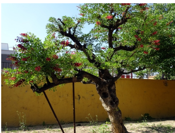
Foto 15. Aspecto de los tutores en Mayo de 2018, con el árbol en floración.

En el año 2013 se seca de forma fulgurante la palmera canaria que se hallaba en el mismo parterre, siendo talada (foto 12), y la eritrina se mantiene aparentemente igual durante los años posteriores (fotos 13 y 14), aunque se le colocan dos soportes en una de sus ramas principales para evitar que se quiebre por su peso (foto 15).