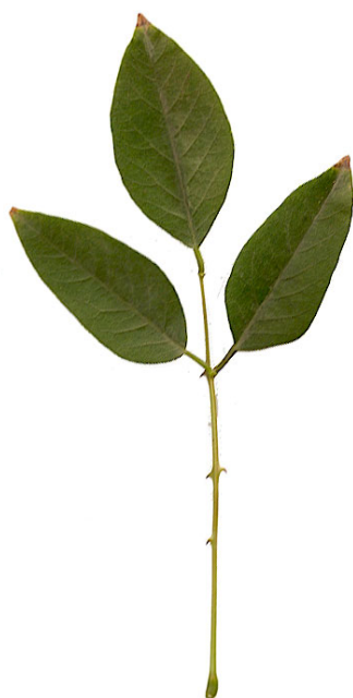
Detalle de una hoja

Etimología: El género procede del griego erythros = rojo, en alusión al color predominante en las flores de la mayoría de especies. El epíteto específico crista-galli procede del latín crista-ae = cresta y gallus-i = gallo, en alusión al estandarte o pétalo mayor de las flores, que recuerda a la cresta de un gallo.